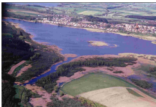
Jezioro Liwieniec - rezerwat przyrody