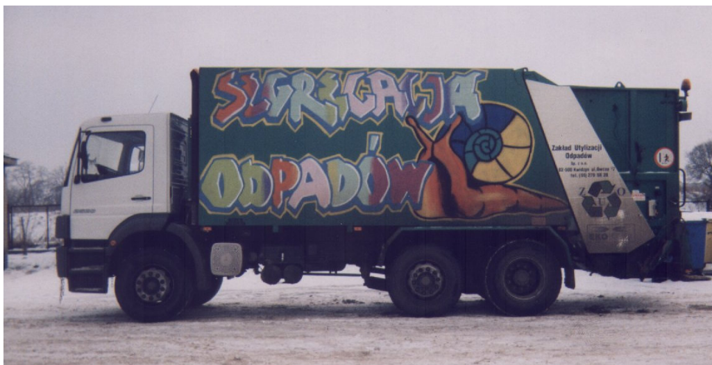
Rys. 6.3 Samochód do odbioru segregowanych odpadów od mieszkańców