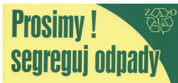
Rys. 6.4 Naklejka na pojemniki do segregacji odpadów