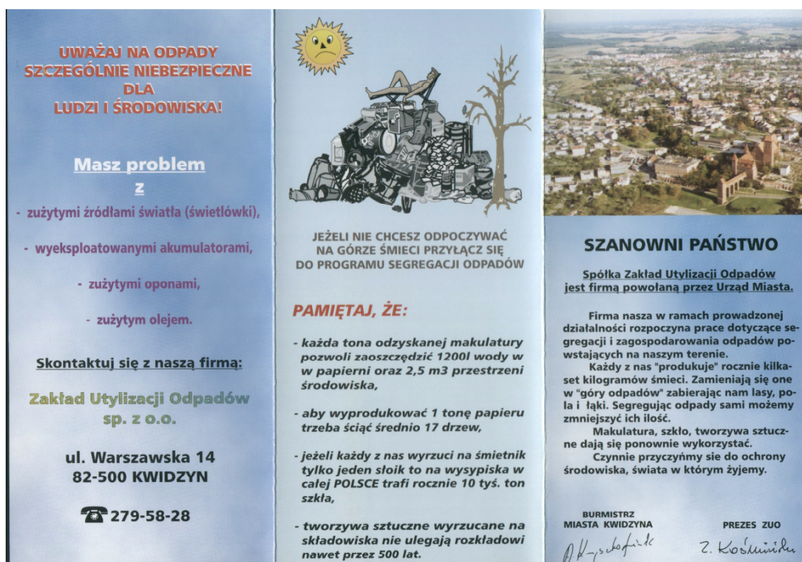
Rys. 6.1 Ulotka promująca segregację odpadów dla mieszkańców Kwidzyna