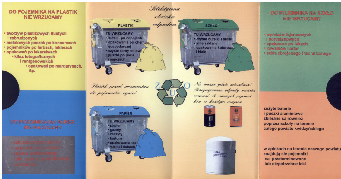
Rys. 6.2 Ulotka promująca segregację odpadów dla mieszkańców powiatu